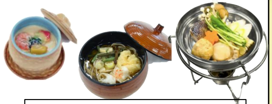
茶碗蒸し+そば+ミニ鍋