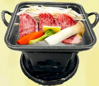
やわらかサーロインの 陶板焼き (750円)