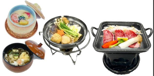
茶碗蒸し+そば+ミニ鍋 やわらかサーロインの陶板焼き