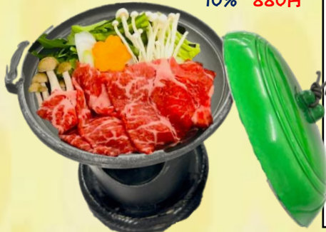
すき焼き鍋 (玉子付き) (850円)