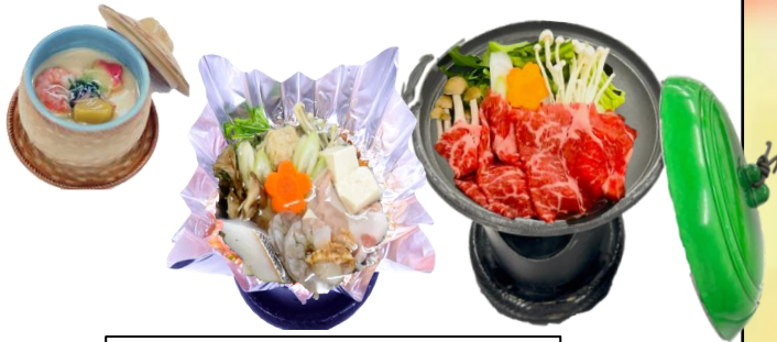
鱈と鶏つみれ鍋 茶碗蒸し+すき焼き鍋