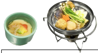
ミニ茶碗蒸し+ミニ鍋